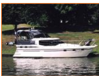
Vri-Jon Contessa 40E