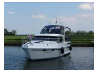
Vri-Jon Contessa 37