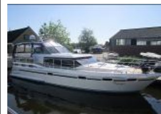
Vri-Jon Contessa 45RX