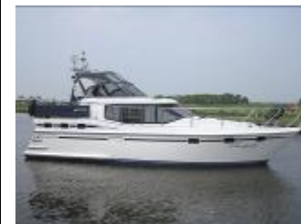
Vri-Jon Contessa 37E