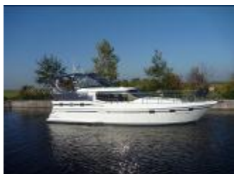
Vri-Jon Contessa 40E