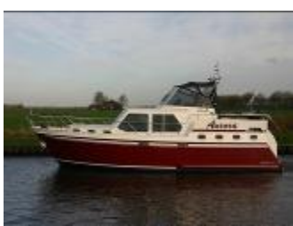
Zijlmans Eagle 1200