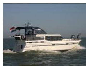
Vri-Jon Contessa 45EX