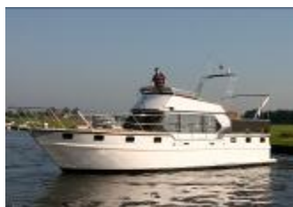
Alm Bakdek Kruiser