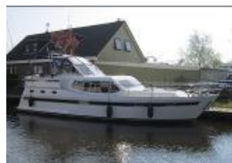
Nowee 38 DL