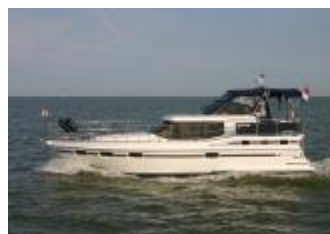
Vri-Jon Contessa 40R