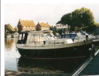
Antaris MK 825