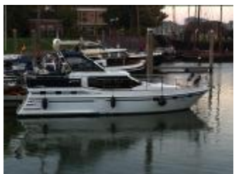
Vri-Jon Contessa 40E